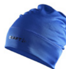
346000 Club Cobalt