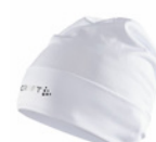
900000 Team Green