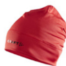
430000 Bright Red