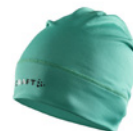
651000 Team Green